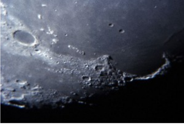
Cámara CANON EOS 600D ISO 800 a \frac{1}{4} Telescopio CELESTRON Catadioptrico 9' \frac{1}{4} "