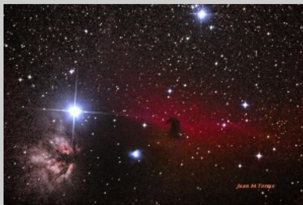
"Navegando" por la Nebulosa del Caballo.