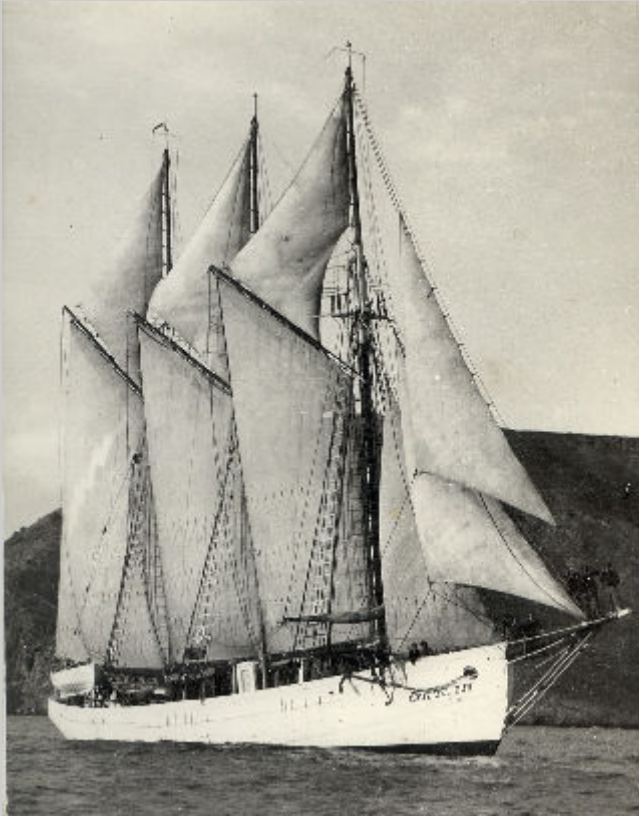
La "Cruz del Sur", navegando placidamente

El éxito obtenido junto a mis compañeros Alejandro Vera y Juanjo Isach, para localizar y fotografiar la luna de Júpiter Amaltea, de una dimensión de 270 km y una magnitud de 15'5 me decidió profundizar en el tema, localizando y fotografiando a satélites de Urano, Neptuno y también al mismo Plutón.